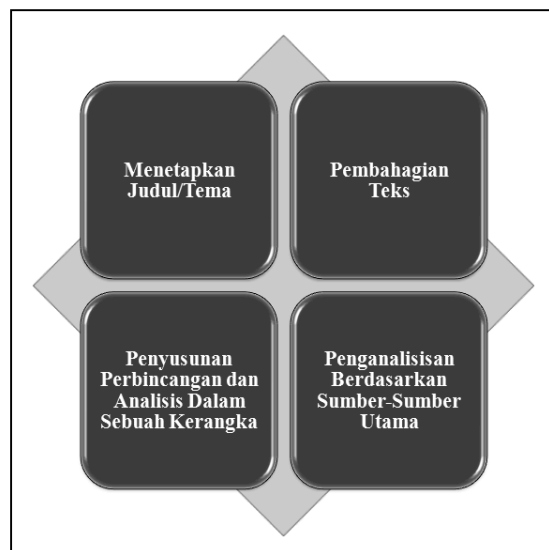
Rajah 3: Langkah-Langkah Analisis Teks Berdasarkan Kaedah al-Mawdu'iy

Semua langkah analisis teks berdasarkan kaedah al-mawdu'iy yang dibincangkan ini diringkaskan seperti Rajah 3.